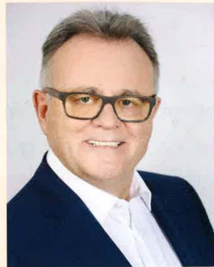
»»» Sportreferent Landeshauptmann Hans Niessl

Mit dem neuen Magazin „Tennis Power Burgenland“ steht nun den Aktiven, Funktionären und schließlich