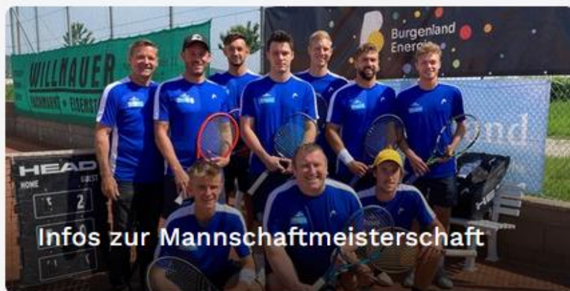
Infos zur Mannschaftmeisterschaft

Scanne, sei dabei und bleib immer up to date! Unsere neuen WhatsApp-Kanäle warten auf dich! 😊